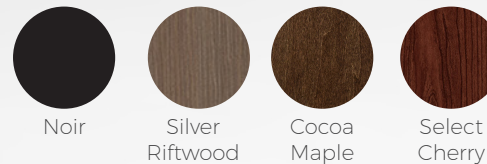
Noir Silver Riftwood Cocoa Maple Select Cherry